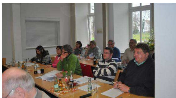
Seminar Flusskrebse 2010